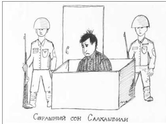
Страшный сон Саакашвили

визит в Китай и прибывает во Владикавказ. Первые сведения о зверствах грузинской армии; – 9.08. Россия вводит войска в Южную Осетию. Цхинвал и 10 осетинских сел разрушены; – 10.08. Ввод дополнительных российских войск в Абхазию; – 12.08. Абхазия начала операцию в Кодорском ущелье; – 11-12.08. Отступление грузинской армии; – 12.08. Приезд С.К.Шойгу в Цхинвал; – 12.08. США заблокировали совещание Россия-НАТО;