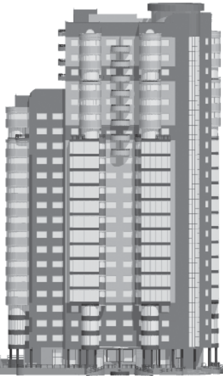
ФАСАД по ул. 2-й Филевской

Также «инициативной группой» утверждается, что в результате строительства у жителей соседних домов не останется возможности пользоваться детской площадкой. При этом «инициативная группа» сознательно