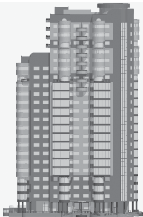
ФАСАД по ул. 2-й Филевской

екту не прозвучало. Но все же освежить в памяти некоторые уже подзабывшиеся данные не будет лишним.