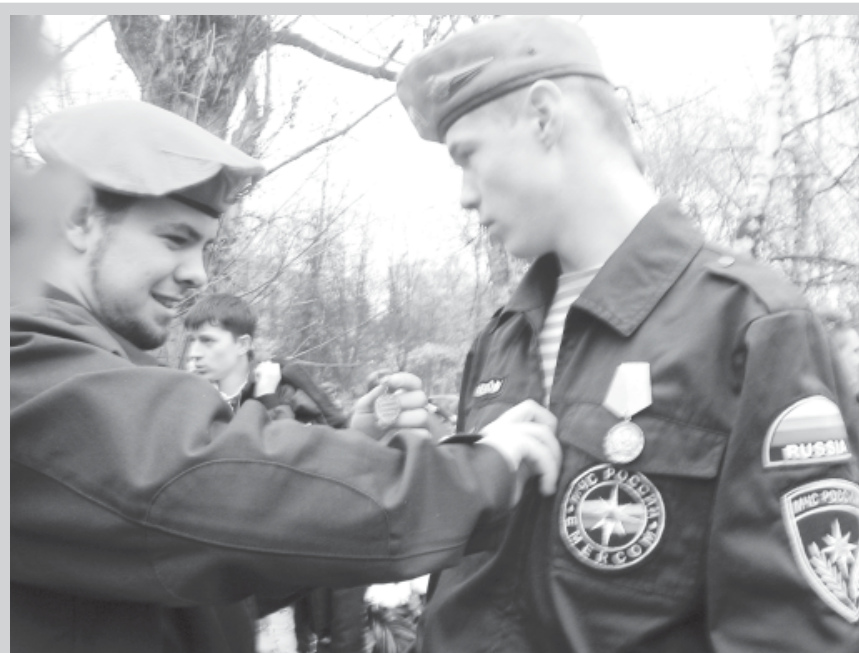
Эти крепкие ребята из поискового отряда Политехнического колледжа №42, как и многие другие их товарища, не будут бегать от армии. Наоборот, они готовятся к ней и служить будут достойно.