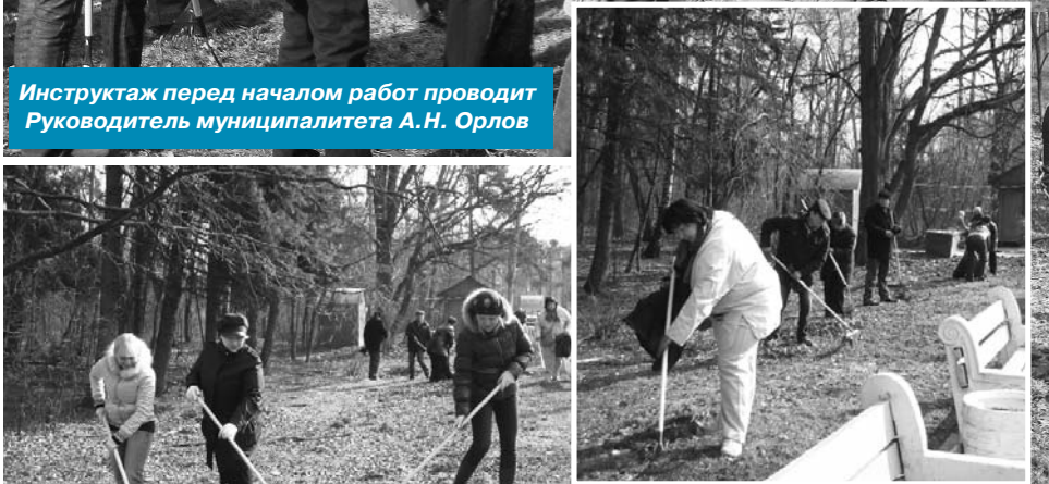
И закипела работа!