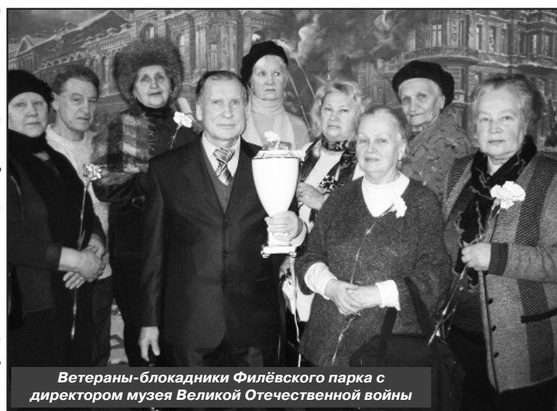
Ветераны-блокадники Филёвского парка с директором музея Великой Отечественной войны