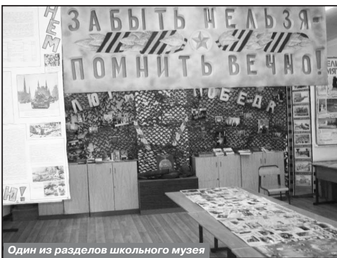
Один из разделов школьного музея

ний — вопросы бюджета. Очень серьезные и проблемные вопросы, потому что хоть и существует законодательство Москвы, которое регламентирует финансовую деятельность района, но в то же время конкретное осмысление порядка финансирования является именно нашей депутатской деятельностью. Мы, комиссия по бюджету, уже подготовили и приняли решения по четырем очень важным аспектам финансово-хозяйственной деятель-