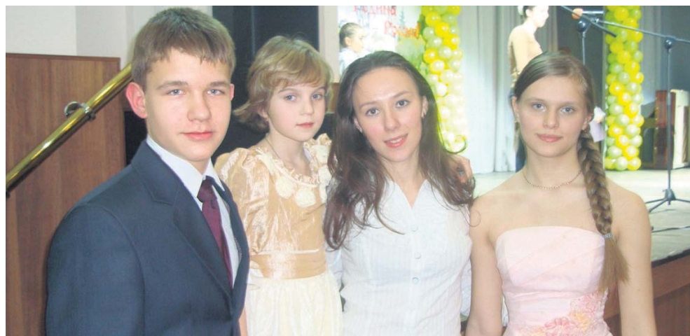
Детская общественная организация школы № 737 «Филёвский дворик» на фестивале «Моя Родина — Россия»