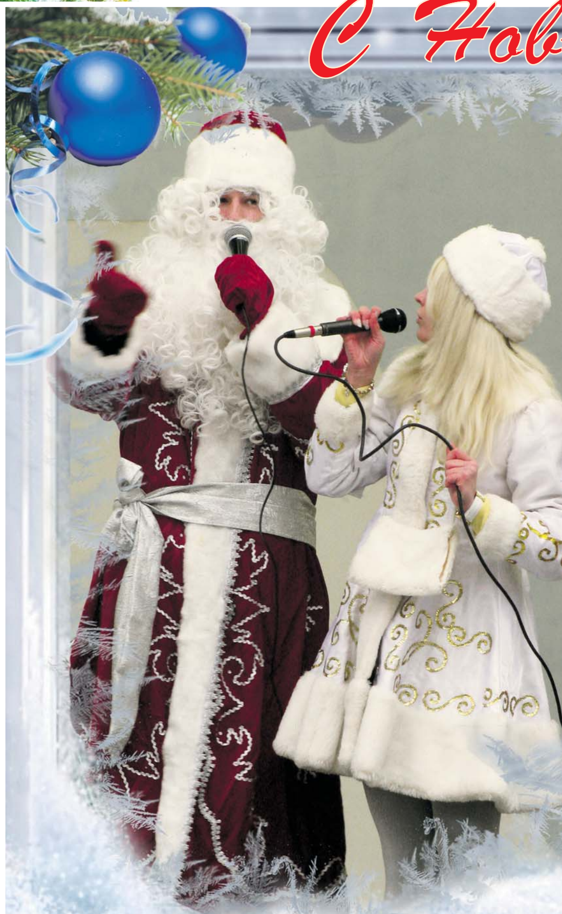
Дед Мороз и Снегурочка в Детском парке "Фили"

Дорогие друзья! Ежедневно со 2 по 7 января 2011 года в Парке культуры и отдыха «Фили» (ул. Барклай, 22) будут проходить Новогодние театрализованные представления с выступлением народных артистов, скоморохов, игрового театра, сказочных героев, цирковых артистов и, конечно же, Деда Мороза со Снегуркой. В игровом театрализованном соревновании смогут участвовать все гости. Приходите всей семьей со 2 по 7 января с 12:00 до 14:00 на главную аллею Филёвского парка! С Наступающим Новым годом!