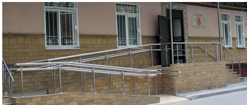
Вход в ЦСО Филёвский парк оборудован пандусом для людей с ограниченными возможностями

функции. Также в 2011 г. будет создан центр профессиональной переподготовки инвалидов, не имеющих работы. Во всех административных округах г. Москвы планируется открыть пункты проката технических средств реабилитации, а также служб персональных помощников. Еще одним заметным шагом вперед станет создание общественной инспекции, которая будет заниматься проверкой обеспечения.