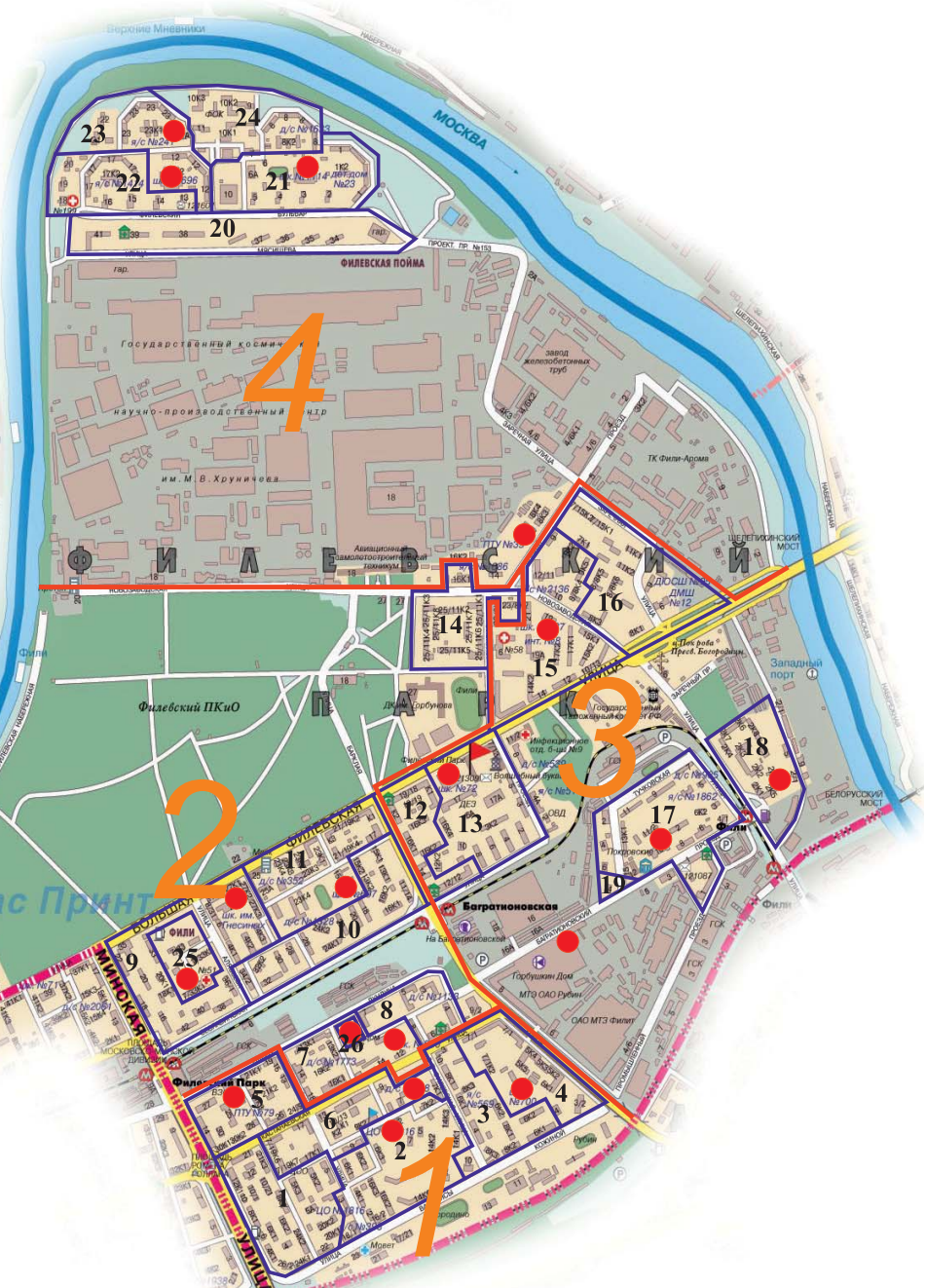
СХЕМА ИЗБИРАТЕЛЬНЫХ ОКРУГОВ внутригородского муниципального образования Филёвский парк в городе Москве